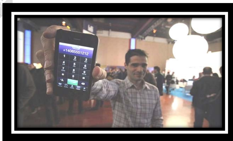
تصویر تلمن مارکو

وایبر یک اپلیکیشن است که همانطور که قبلاً گفته شد توسط شرکتی به همین نام به صورت رایگان تولید می‌شود. با استفاده از این نرم‌افزار می‌توانید با دوستان خود که این اپلیکیشن را نصب کرده و به اینترنت متصل هستند به صورت رایگان ارتباط تماس تلفنی و پیامکی داشته باشید. البته این اپلیکیشن رو به گسترش برای گوشی‌های همراه هوشمند هست که با استفاده از شبکه‌های بی‌سیم 3G کار می‌کند. وایبر از رابط کاربری جذابی بهره می‌برد و صدای مطلوب آن در برقراری تماس صوتی باعث شده تا بیش از ۱۴۰ میلیون کاربر را به خود اختصاص دهد. جالب است بدانید کاربران در روز حدود ۱۰ میلیون مکالمه با میانگین ۲ میلیارد دقیقه انجام می‌دهند و بیش از ۶ میلیارد پیامک در ماه ارسال می‌کنند.