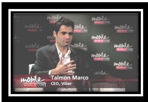
( تصویر تلمن مارکو )

Talmon Marco که فارغ التحصیل علوم کامپیوتر از دانشگاه تل آویو (در اسرائیل) است، قبلا به عنوان CIO که مدیر بخش فناوری اطلاعات و کامپیوتر محسوب میشود در ارتش اسرائیل (Israel Defense Force – IDF) مشغول به کار بوده است. او (به ظاهر) پس از خروج از ارتش اسرائیل، به آمریکا میرود و چندین نرم افزار با کاربری مشابه وایبر نظیر Badoo و iMesh را ایجاد و بنیانگذاری کرد. این نرم افزارها اساسا مبتنی بر نظارت بر داده های کاربران است، Badoo برنامه ای برای اضافه کردن ابزاری به صفحات مشاهده شده ی کاربران در اینترنت است که با نصب یک ویندوز سرویس روی کامپیوتر کاربر به صورت دائمی و نامحدود امکان هر کاری روی کامپیوتر هدف را دارد. نرم افزار iMesh امکان به اشتراک گذاری فایل خصوصا صوت و فیلم را به کاربران میدهد. جالب است بدانید در ایالات متحده سایتها و سرورهایی که جهت به اشتراک گذاری فایل های غیر رایگان ایجاد میشوند، در سالهای اخیر توسط دولت آمریکا مسدود شده و تحت پیگرد قرار گرفته اند. بستن Tracker های معروف فناوری تورنت را میتوان از این سنخ دانست (جستجو کنید P2P legal issues). اصولا دولت آمریکا جهت حفظ منافع شرکت های ذی نفع در موسیقی ها و ویدئوهایی که به رایگان در شبکه های کاربری کار (P2P) به اشتراک گذاشته میشوند، همیشه در مورد این فناوری سخت گرفته است، اما iMesh یک استثنا است! Marco به استناد منابع مختلف (از جمله مصاحبه هایش و نیز مقالات Week Business) دوست قدیمی Igor Megzinik است، و این دوستی به همکاری شان در ارتش اسرائیل (IDF) بر می گردد. Marco در حال حاضر به عنوان CEO (مدیر عامل) و Magazinik نیز که فارغ التحصیل کامپیوتر از اسرائیل است، به عنوان CTO (مدیر فناوری) شرکت وایبر مدیا مشغولند.